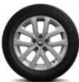
Fellne Alumini 17" Aquila