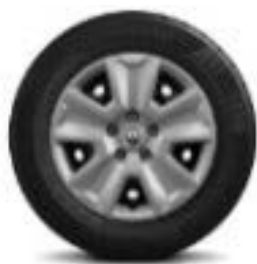
Rrota nga qeliku 16" me kapake dekorues Pragma