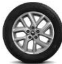
Fellne Alumini 17" Impulsion