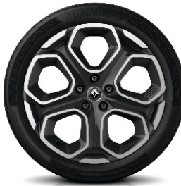
Fellne Alumini 19" Extreme