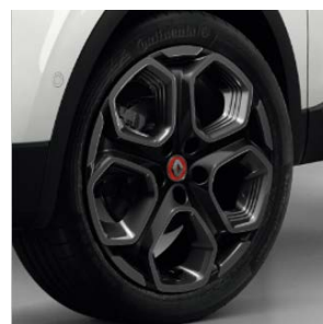
Fellne Alumini 19" Extreme SHADOW