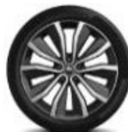
Fellne Alumini 19" Egeus